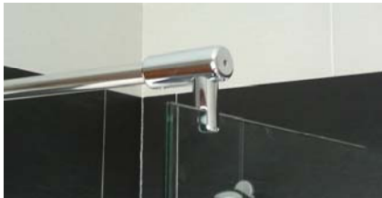
Detalle de refuerzo para vidrios fijos.