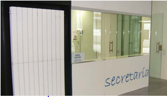
Los perfiles de corredera son idóneos al no necesitar excesiva obra