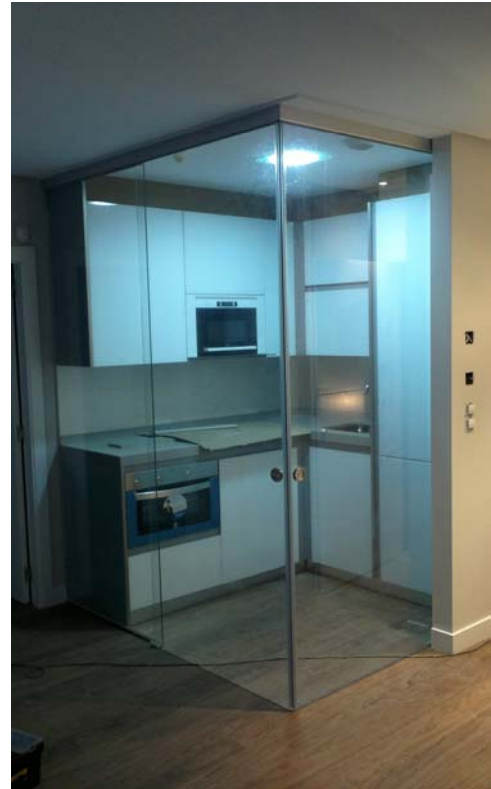
Cierre de cocina con 2 puertas corredera colocadas en ángulo, sin perder luminosidad.