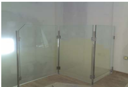
El uso de vidrios en instalaciones interiores dan mayor sensación de amplitud en las estancias