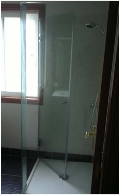
Mampara para ducha, de una puerta abatible sobre bisagras instaladas en la pared.