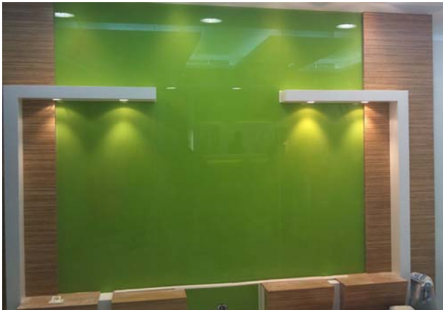
Los vidrios lacados son una magnífica opción para dar un toque de colorido y distinción