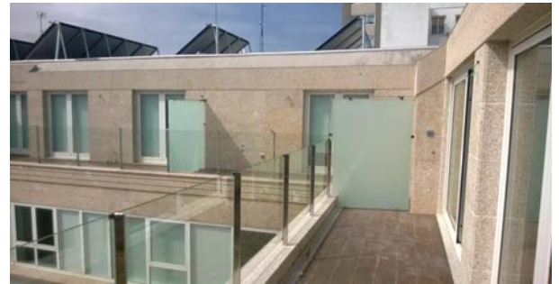
Un estética forma para delimitar estancias