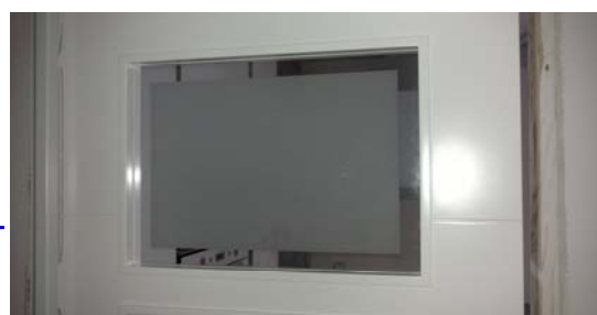
La utilización de vidrios, incoloros, mateados, biselados y todas las posibles manufacturas en los mismos ofrecen una gran variedad decorativa