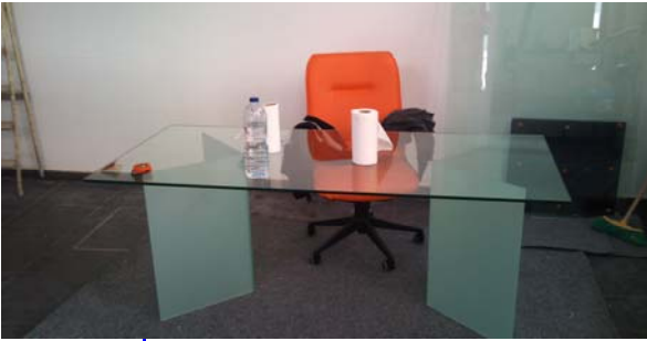
Mesa de cristal, con superficie y estructura realizadas con vidrio de seguridad