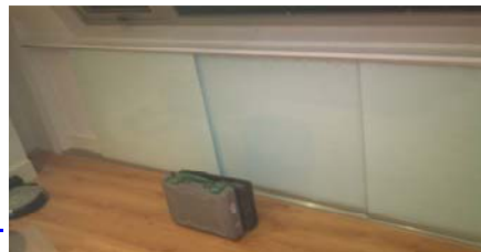
Los cierres con perfiles de vitrina, una excelente opción para aprovechar espacios.