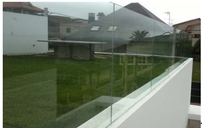
Las barandillas acristaladas permiten aprovechar al máximo las vistas del entorno