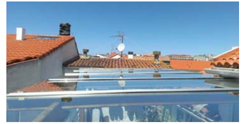
Tejadillo acristalado con vidrio laminar de seguridad y colocado con perfil de tapeta, una manera de cubrir zonas aprovechando al máximo las condiciones de luz natural