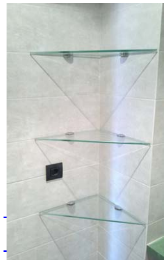
Estantería formada con vidrio laminado de seguridad.