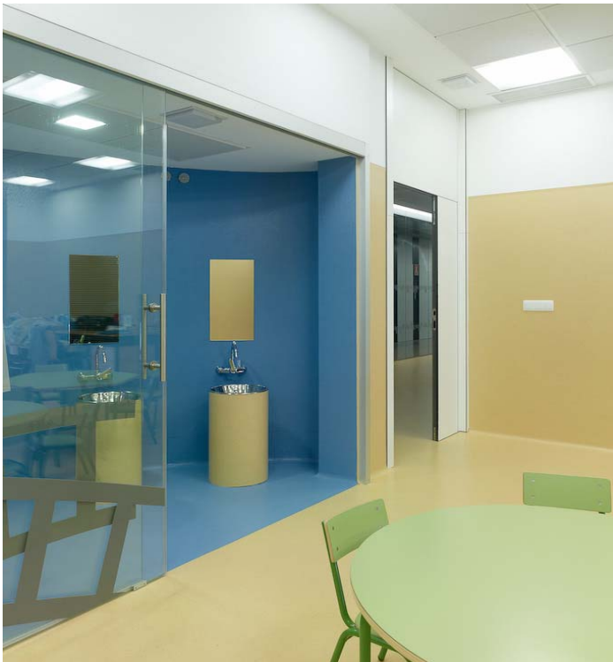
Un cierre con guías corredera, ofrece una mayor amplitud de paso al no necesitar perfilera intermedia para las puertas