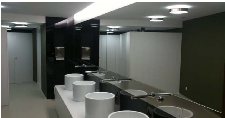
Los espejos, un elemento indispensable en cualquier baño

Uso del vidrio para decoraciones de interiores y exteriores, en sus numerosas posibilidades. Instalación de vidrios de color, espejos, mateados decorados, vidrios