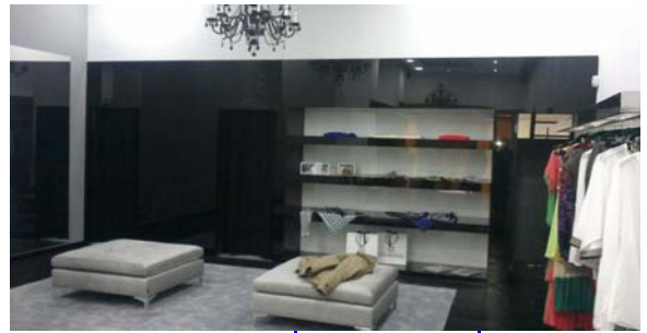
El uso del vidrio para el forrado de paredes, mueble, etc... permite obtener un acabado elegante de las instalaciones